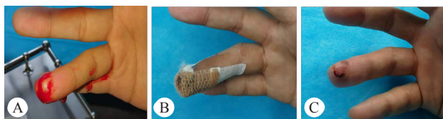
A: 右手无名指被玻璃划伤, 形成小皮瓣, 直径约 8 mm, 90% 游离, 压迫数十分钟后仍出血不止, 包扎的敷料立即被出血浸透; B: 用宽 15 mm 的 SSAW 轻度拉伸后斜行跨指尖包扎, 出血立即停止; C: 2 d 后观察小皮瓣存活, 颜色正常