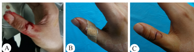
A: 右拇指背侧皮肤撕裂伤, 形成长方形皮瓣, 出血明显, 部分皮下脂肪组织暴露; B: SSAW 螺旋式减张免缝加压包扎, 拇指末梢血运良好, 无肿胀; C: 5 d 后伤口闭合良好, 皮瓣颜色正常